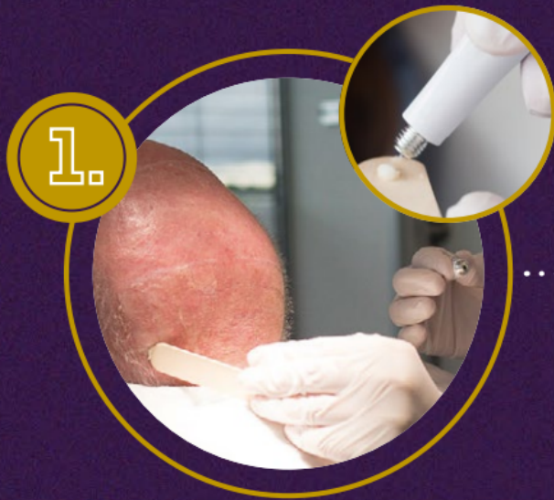
1. Auftragen der Wirkstoff-Creme